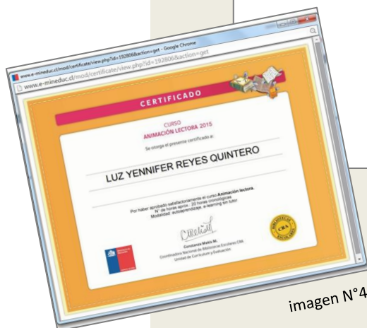
imagen N° 4